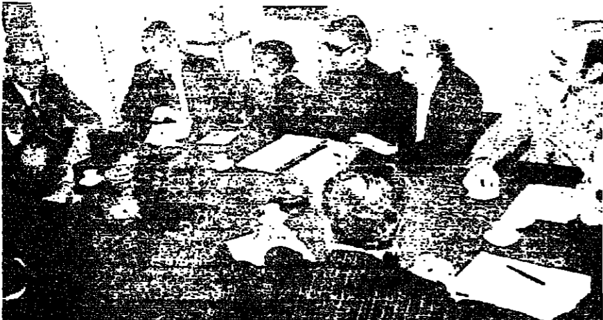
اعضاء الاتحاد العمالي العام